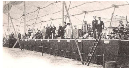
Abbildung 2 Freakshow des Zirkus Barnum&Bailey

In Nordamerika wurde der Zirkus vor allem durch den Zirkusdirektor P.T. Barnum bekannt, welcher mehrere Wanderzirkusse betrieb und im Jahr 1841 dann „Barnums-American-Museum“ gründete, für welches er bis heute bekannt ist. Dort gab es zusätzlich zu den normalen Zirkusattraktionen aus Europa noch Attraktionen wie ein Wachsfigurenkabinett oder die Sideshow, bei welcher es sich um eine US-Amerikanische Spezialität handelte, welche z.B. eine Freakshow, Theater oder eine Völkerschau sein konnte. 4