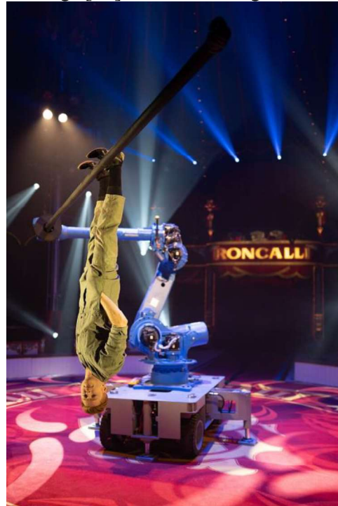
Abbildung 3 Zirkus Roncalli Tournee 2019

Nach dem zweiten Weltkrieg gab es auch unter den Zirkussen einen Wiederaufbau und mehrere Neugründungen wie den Zirkus Roncalli oder den Cirque du Soleil, welche einen etwas anderen Ansatz verfolgten, so war zum Beispiel Roncalli der erste Zirkus nach dem Zweiten Weltkrieg, welcher in Deutschland komplett auf Wildtiere verzichtete. Der Cirque du Soleil setzt in seinen Vorstellungen auf traditionelle Artistik, sowie Theater und Tanz. Die TAZ faßte die Begeisterung des Publikums folgendermaßen zusammen: „Das Publikum, das sie nicht sah, tobte dennoch. Nicht nur bei dieser Nummer. Und nicht ganz zu Unrecht.“ 6